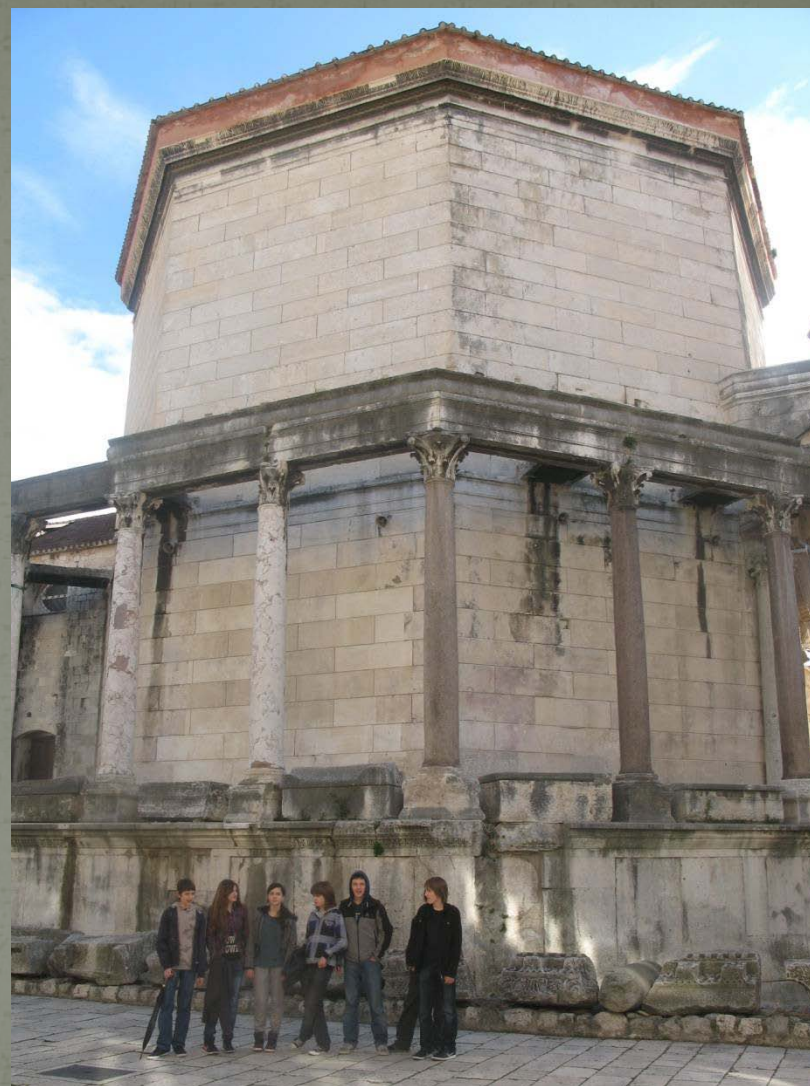
Dioklecijanov mauzolej, danas splitska katedrala