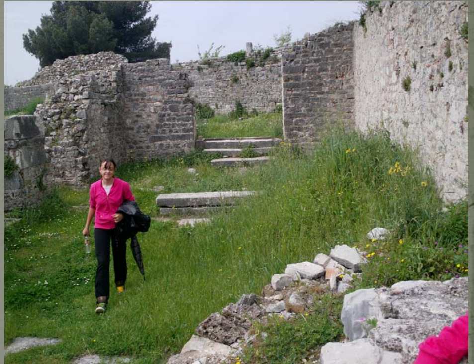
Oratorij iz 3. st.