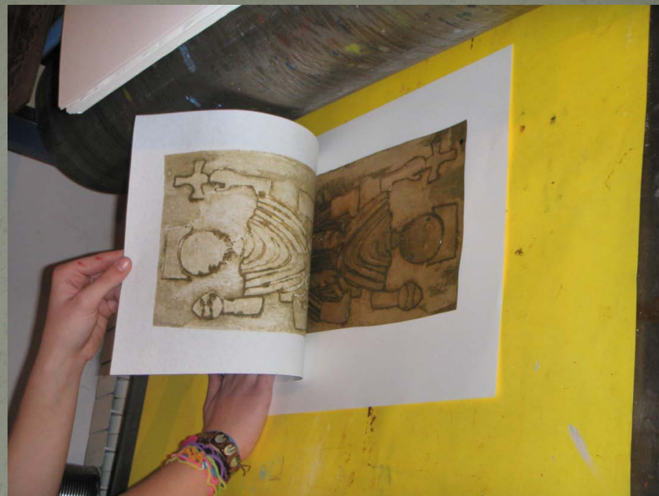
Izrada grafika s prikazom kralja Petra Krešimira IV.