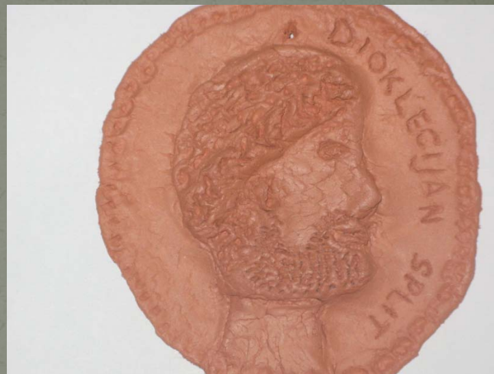
Prikaz Dioklecijana na medaljonu