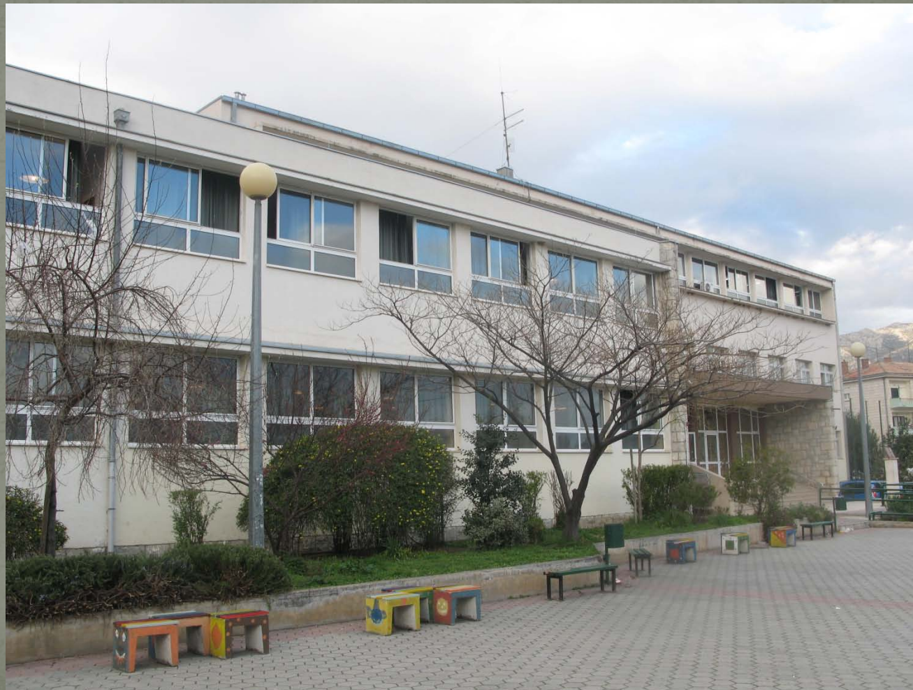
Oš don Lovre Katića