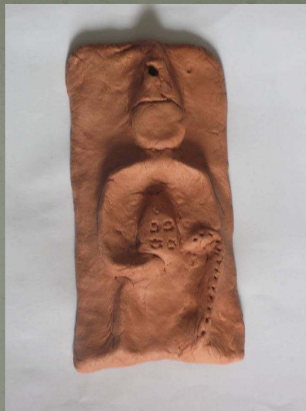
Stilizirani prikaz Sv. Dujma